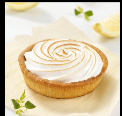
Ou une tartelette au citron....